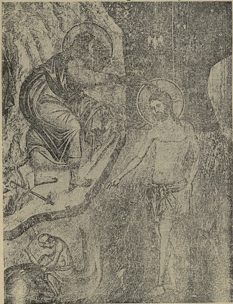
Η ΒΑΠΤΙΣΙΣ ΤΟΥ ΧΡΙΣΤΟΥ ΤΟΙΧΟΓΡΑΦΙΑ ΤΟΥ ΙΣΤΟΡΙΚΟΥ Ι. ΝΑΟΥ ΤΟΥ ΠΡΩΤΑΤΟΥ "Έργον Πανσελήνου (1540).